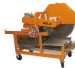
Ziegelsäge BS 1000