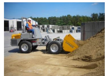
PAUS SMK 365