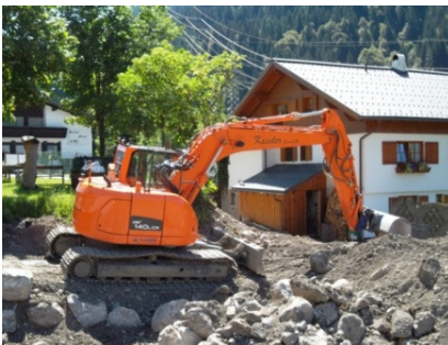
Doosan Kurzheckbagger DX 140 LCR