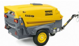
Kompressor XAS 87