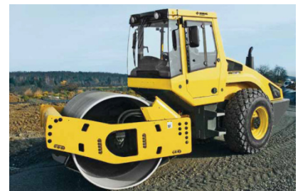
BW 213 DH-4i