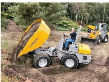
PAUS AKR 185