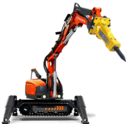
Abbruchroboter DXR 300