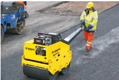
BW 65 H