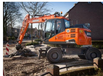
Doosan Mobilbagger DX 165 W