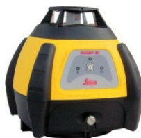
Hochbaulaser Rugby 50