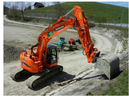
Doosan Kurzheckbagger DX 235 LCR