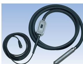
Innenvibratoren Lati U