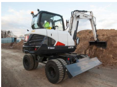
Bobcat Mobilbagger E 57 W