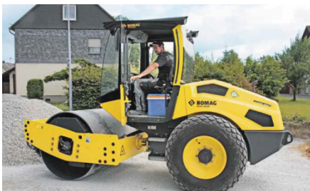
BW 177 DH-5