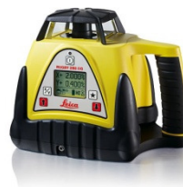
Neigungslaser Rugby 280