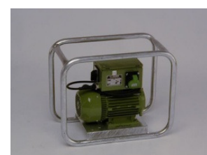
Frequenzumformer URmS 2