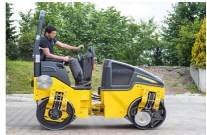
BW 120 AD-5