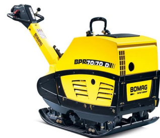
BPR 70/70 D/E