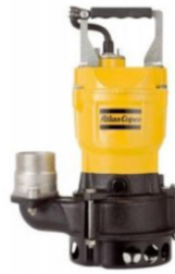
WEDA 04 S