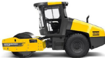
CA 1500 D