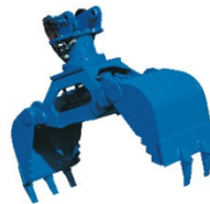
Steingreifer UG 15