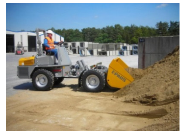
PAUS SMK 9036